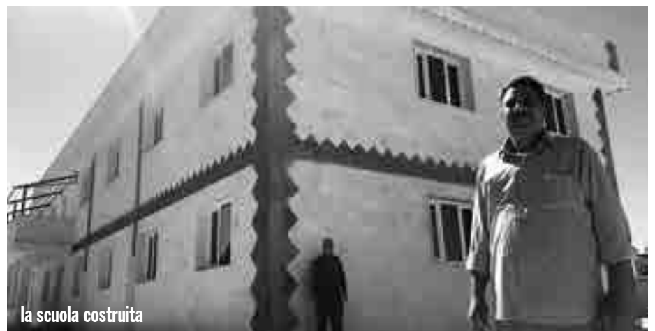
la scuola costruita

Attualmente nella città di Kobane la situazione è relativamente tranquilla. Relativa poiché periodicamente vi sono degli attentati dell'Isis. Ma quel che veramente preoccupa la popolazione è quel che succederà nell'immediato futuro. Una parte del Rojava, la regione di Afrin, è sotto controllo delle milizie filo turche installatesi dopo l'invasione militare turca dello scorso anno con l'operazione "Ramoscello d'ulivo". C'è dunque preoccupazione su cosa succederà a Nord con la Turchia, ma altrettanto a